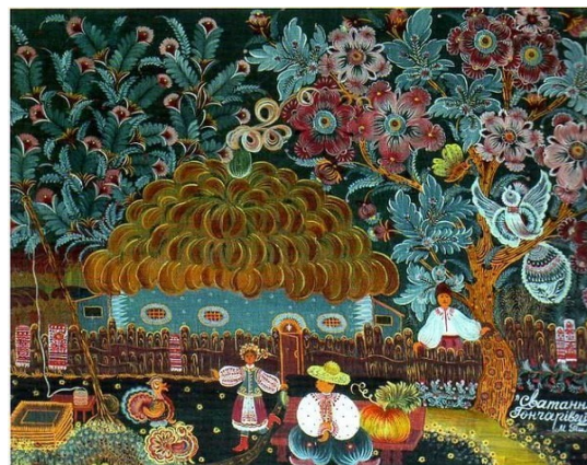
Іл. 10. М. Тимченко