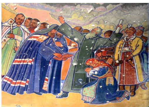
Іл. 7. Ю. Буцманюк. Проповідь Івана Вишенського. Розпис із монастиря Різдва Христова в Жовкві (Б. Хмельницький, І. Вишенський, І. Мазепа, Г. Гулевичівна та інші видатні православні України)

Матінки, була списана з жовківчанки, у яку молодий художник певний час був закоханий. З чотирьох янголів, що прикрашають купол каплиці, двоє списані з жовківських малих єврейок, а двоє інших – з українських дітей. Розпис жовківської каплиці став першим в історії мистецтва прикладом поєднання сецесійного романтизму та української народної традиції. Уперше вишиванки з'явилися на церковних фресках, українська культура проявила себе в церковному мистецтві, на стінах храму поєдналися духовні та національні традиції, відверто переплелися християнський та український дух (ілюстрація 7) (Заславський, 2023).