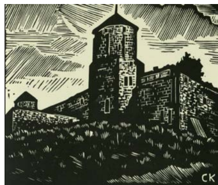
Іл. 1. С. Кукуруза. Башта Кармалюка Старої фортеці м. Кам'янець-Подільський

Кам'янецьчині. Упродовж творчих пошуків художник створив понад 2,5 тисячі графічних аркушів – це вагомий спадок, проте його життя й творчість досліджено не повністю, оскільки недостатньо архівних даних, задокументованих спогадів сучасників, які б засвідчили особистість митця. У низці робіт він вдало виявляє позитивне, орієнтоване на мистецькі принципи, які визначав М. Бойчук, а саме: на освоєння досягнень Візантійського та давньоруського мистецтва, на традиції народної творчості. Станкова й книжкова графіка, агітаційний плакат, оформлення журналів і газет – до всього з успіхом доклав художник свого уміння, свого таланту. Володіння найрізноманітнішими графічними техніками: офорті й літографії, ліногравюрі й ксилогравюрі дали змогу виявити особисті виражальні можливості для втілення свого задуму. Також С. Кукуруза працював на лінолеумі, надавши перевагу чорнобілій графіці, у якій виконав свої найліпші твори, не забуваючи кольорову ліногравюру й офорт (ілюстрації 1–3.) (Ільїнський, 1994, с. 134–137).