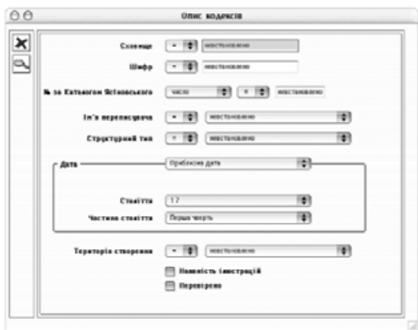
Рис. 1. Структура опису кодексів в Базі Даних «Ірмос»

ського було започатковано комп'ютерний проєкт Базу Даних «Ірмос» у формі цифрового архіву (Бондаренко, 3). Змістом цього проєкту став, з одного боку, докладний опис українських рукописних нотолінійних збірників XVI–XVIII століть – ірмологіонів, докладно опрацьованих і опублікованих Ю. Ясіновським у Каталозі «Українські та білоруські нотолінійні Ірмолої 16–18 століть» (Ясіновський, 13):