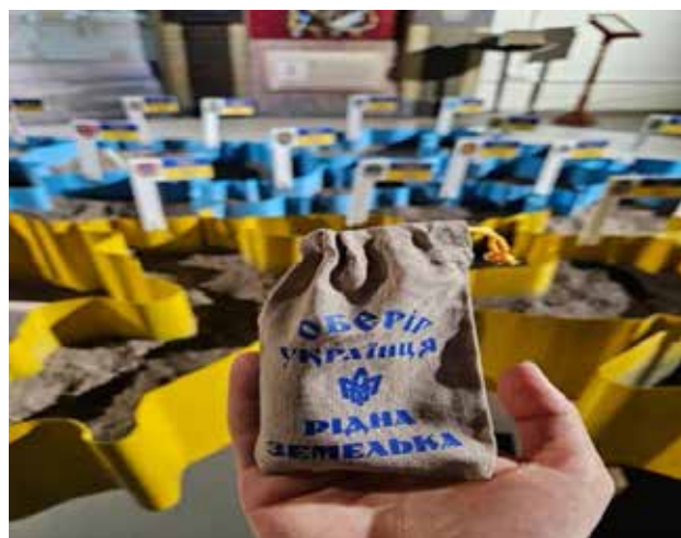
Рис. 1. Експозиція музею «Становлення української нації»

У Національному музеї історії України у Другій світовій війни відбулось офіційне завершення реалізації проєкту «Тризуб Батьків-