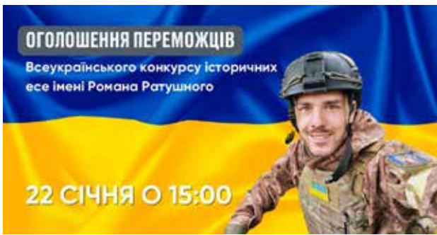
Рис. 6. Анонс оголошення переможців онлайн-конкурс історичних есе «Герої в боротьбі за Незалежність України: дослідження національної ідентичності в суспільних трансформаціях ХХІ ст.»

є історичні мапи, за допомогою яких можна простежити, як змінювалися кордони і топоніми України упродовж віків, і що з давніх давен відбувалося на землях сучасної України. Також на стендах є символи влади, герби, печатки та деякі історичні документи. Біля стендів розташовані прапори та знамена, пов'язані з історією української державності. За допомогою QR-кодів, розміщених на стендах, можна дізнатися більше про подію чи історичну постать, прочитавши додаткову інформацію. Пристрої віртуальної реальності дають уяву про події, які відбувалися в Україні нещодавно, з початком повномасштабного вторгнення.