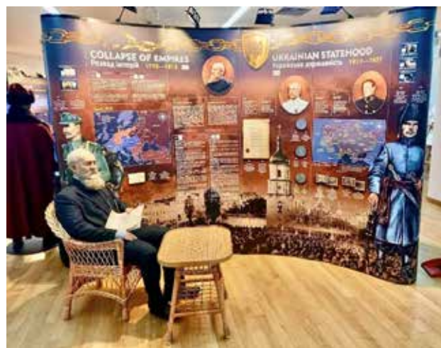
Рис. 5. Експозиція пересувної виставки «Україна. Становлення державності»