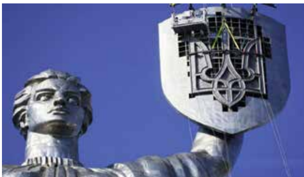
Рис. 2. Скульптура «Батьківщини-Матері» на території Національного музею історії України у Другій світовій війні