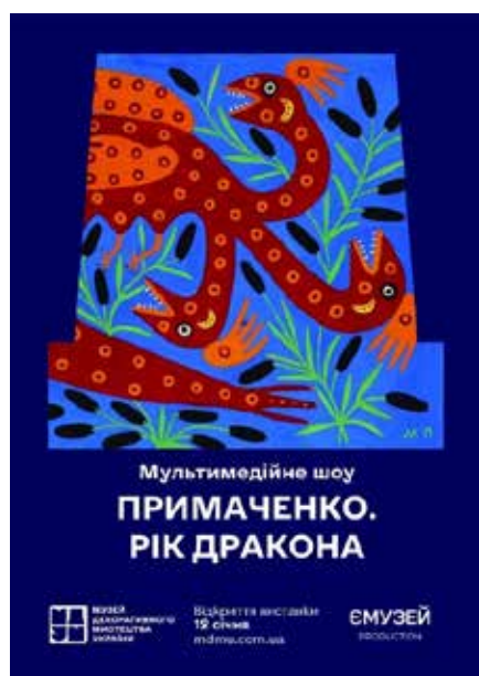
Рис. 4. Афіша мультимедійного шоу «Примаченко. Рік дракона»

На виставці представлені фігури відомих історичних постатей, державотворців, які залишили яскравий слід не лише в історії України, а й історії Європи та світу, виготовлені за новітніми технологіями з матеріалів, що дають максимально реалістичний ефект живої людини. Це історичні персонажі з кібершкіри – державотворці Констянтин Острозький, Михайло Грушевський, Пилип Орлик, Степан Бандера, Роман Шухевич, Епіфаній та інші. На кожному стенді