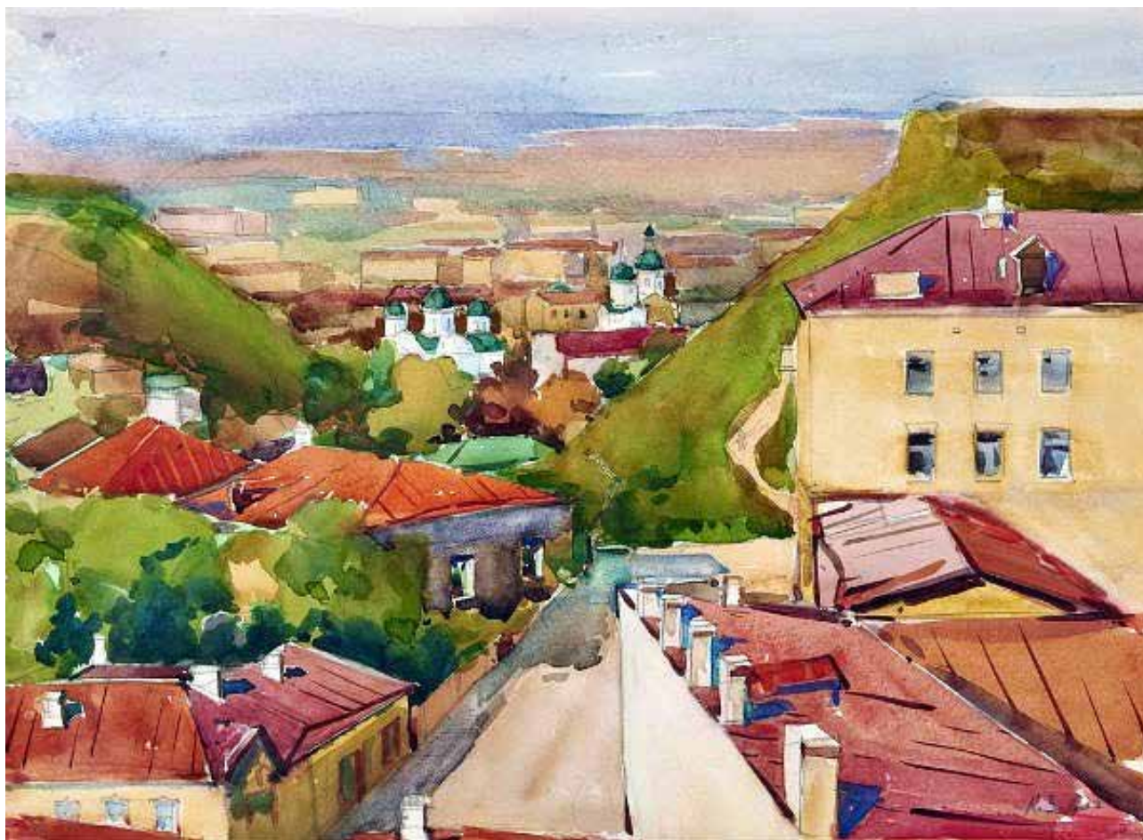
Рис. 7. А. Зернецький «Поділ. Панорама». Папір, акварель (1960)

Ще одна виставкова робота, «Весняна набережна» (рис. 9), сповнена пастельної естетики, наводить на думку про Київ як місто, яке ще не поборолو цілковито природний ландшафт, в якому воно виникло. Дніпро, на якому вже зрушив лід і де тане сніг на берегах, все ще могутніший за велич магістралей та багатоповерхівок, які будуть стрімко линути вгору вже