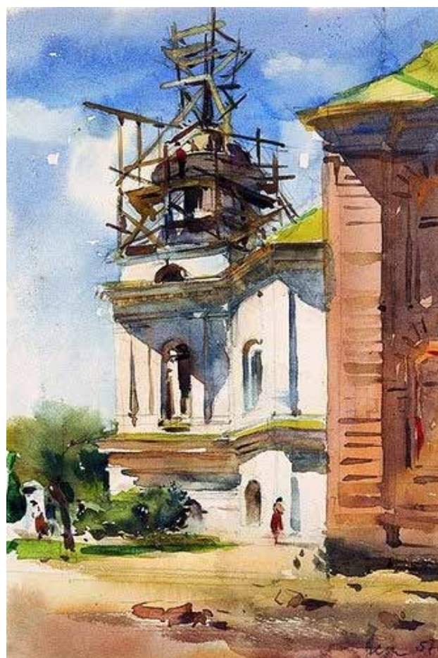
Рис. 3. А. Зернецький «Реставрація Видубицький монастир». Папір, акварель (1957)