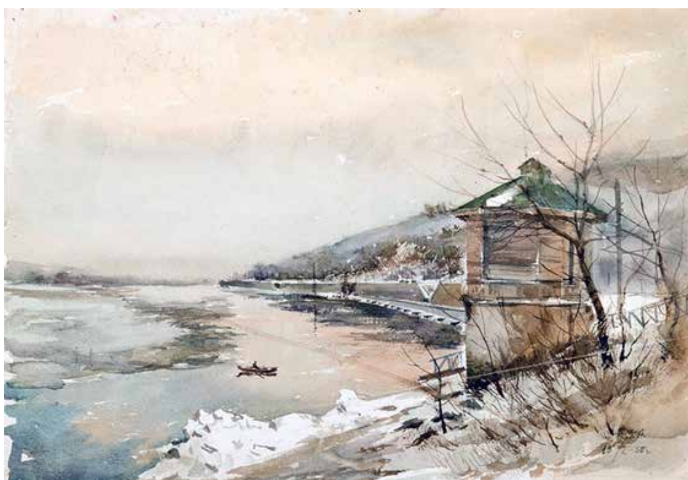
Рис. 9. А. Зернецький «Весняна набережна». Папір, акварель (1956)