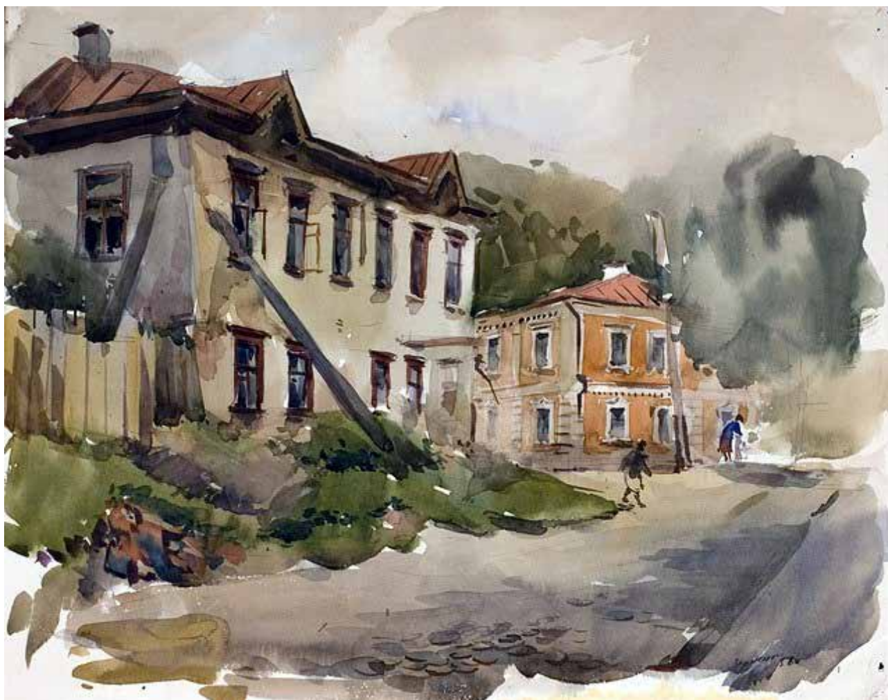
Рис. 8. А. Зернецький «Боричів Тік». Папір, акварель (1956)