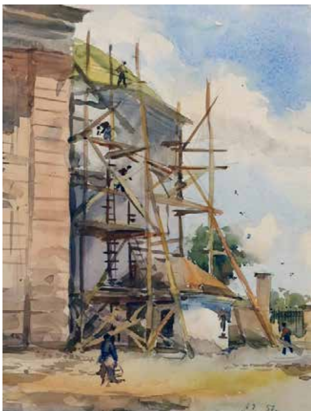
Рис. 2. А. Зернецький «Реконструкція Кирилівської церкви в Києві». Папір, акварель (1957)

У тому ж 1957 р. художник зафіксував для прийдешніх поколінь сцену реставрації це одного визначного архітектурного об'єкта – Свято-Михайлівського Видубицького чоловічого монастиря (рис. 3). Тут вбачається явний