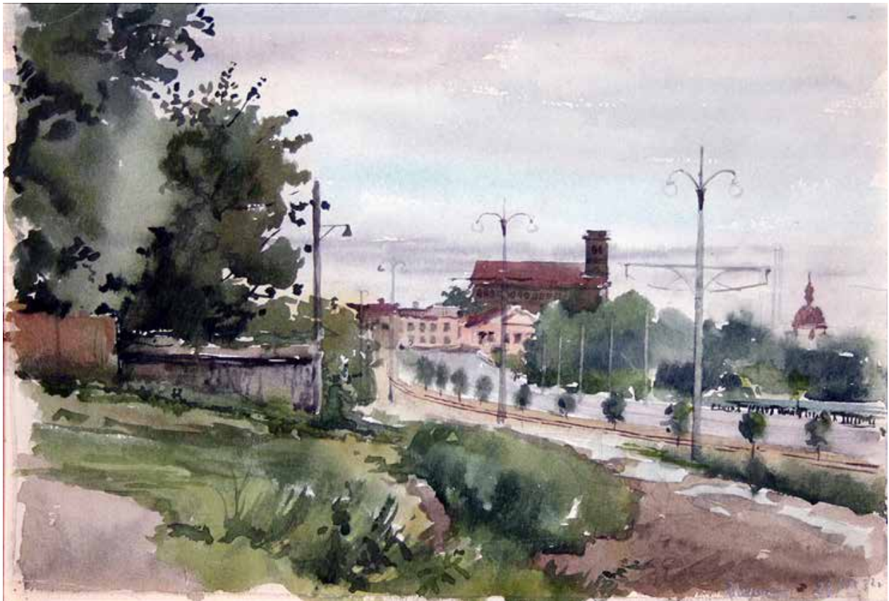
Рис. 6. А. Зернецький «Поділ». Папір, акварель (1952)

Експоновані роботи промовисто засвідчили про ще одну грань таланту Зернецького-аквареліста (Катаєва, 2023). Це його здатність показувати одні й ті ж міські райони чи окремі споруди в різній колірній гамі та навіть художній манері. Так, дві акварелі, на яких зображені панорами історичного Подолу, кардинально відрізняються. Робота від 1952 р. (рис. 6) є зраз-