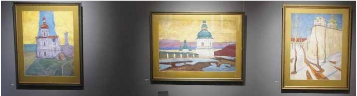
Рис. 5. Фрагмент експозиції виставки «Рідне місто. Київ 60-х» (2023). Національний музей «Київська картинна галерея», м. Київ

ознайомитись із баченням романтики природи в його пейзажах.