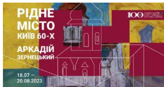
Рис. 4. Афіша виставки «Рідне місто. Київ 60-х» (2023). Національний музей «Київська картинна галерея», м. Київ