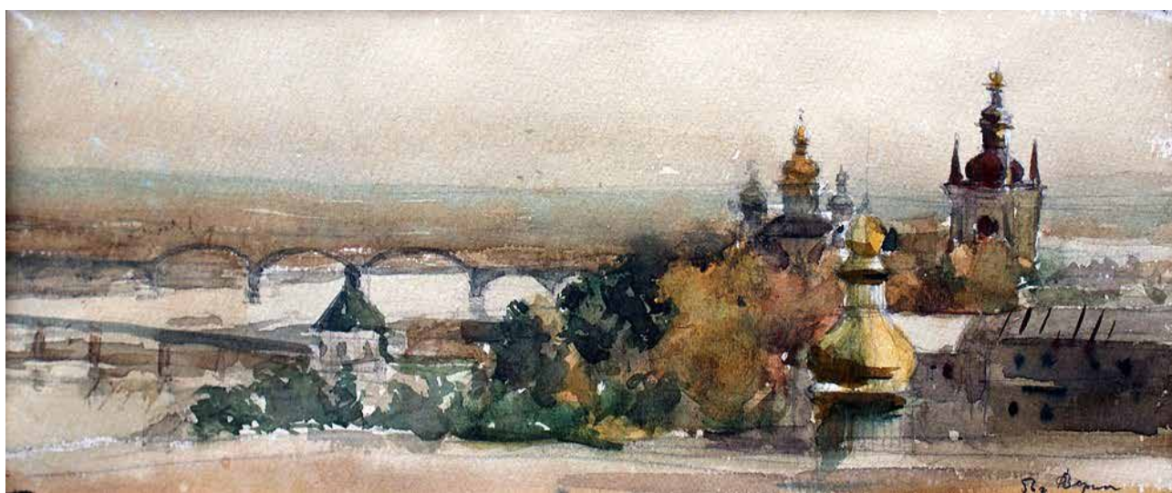
Рис. 1. А. Зернецький «Києво-Печерська лавра». Папір, акварель (1956)

Акварель «Києво-Печерська лавра» (рис. 1), створена художником в 1956 р., є панорамним видом правого та частково лівого берега Дніпра, на той час іще не забудованого новими мікрорайонами, яким ще кілька десятиліть залишалось чекати свого часу. Робота виконана в змішаній техніці, де задній план виведений технікою «а