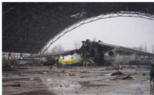
Рис. 3. Літак Ан-225 «Мрія» до та після знищення російськими військами 27 лютого 2022 р.

можності українського народу, який бореться за свою свободу та протистоїть агресору. Ідея проекту отримала продовження. У липні 2022 р. український художник Дмитро Вергелес створив стінопис у м. Бориспіль («Мрія» в Борисполі..., б.д.) (рис. 4а) і ще один стінопис став результатом колективної творчості мешканців м. Гостомель (рис. 4б).