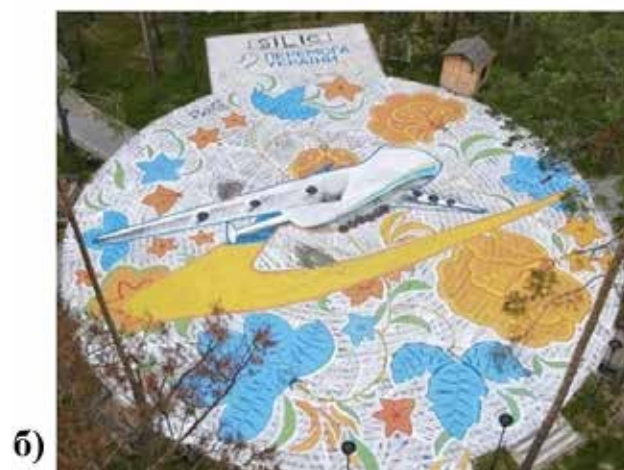
Рис. 4. Стінописи, 2022: а) м. Бориспіль; б) м. Гостомель

були підписані заступником головного конструктора «Антонов» Анатолієм Вовнянком, а один – Головнокомандувачем ЗСУ Валерієм Залужним. До кожного постера була докла-