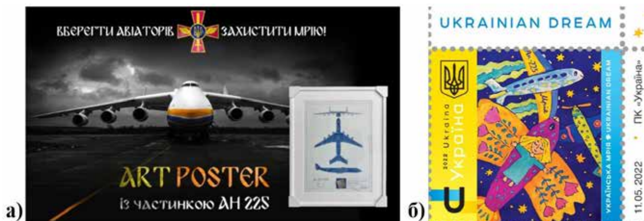
Рис. 6. Лоти благодійних аукціонів: а) артпостер (автор Д. Максименко); поштова марка «Українська мрія»

Висновки та перспективи подальших досліджень. Попри сприйняття Національного павільйону України під час 58-ї як одного з найбільш суперечливих, масштабну критику української артспільноти та подальші публічні пояснення організаторів кураторського проєкту «Падаюча тінь «Мрії» на сади Джардіні», він ввів в міжнародний мистецький обіг образ легенди українського авіапрому, літака АН-225 «Мрія». До початку повномасштабної російсько-української війни проєкт сприймався широким загалом як певна спекуляція на темі цього сучасного символу українського науково-технічного прогресу. Однак у період пандемії коронавірусу літаком доставляли гуманітарну допомогу до Польщі, Німеччини, Франції та Італії. Тож цілком ймовірно, що тінь «Мрії» все ж таки падала на венеційські сади Джардіні, хоч на той час і безлюдні, але для європейців «Мрія» перетворилася з міфу в реальність. Проте після 27 лютого 2022 р. акцент зміс-