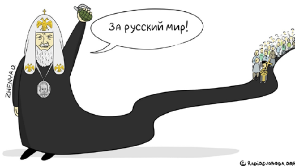
Рис. 2. Карикатура Євгенії Олійник

Яскравим прикладом сатиричного зображення використання релігії в злочинних політичних і воєнних цілях є карикатура українського художника Володимира Казаневського, створена у 2017 році для французького тижневика «Courrier International» (Leïbine, 2017). На ній зображено священника у рясі, який тримає