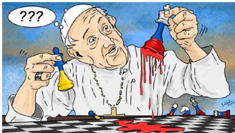
Рис. 4. Карикатура Сергія Коляди

Інший важливий аспект зображення Папи Римського українськими художниками-карікатуристами полягає в критиці його висловлювань про «гуманність» російського народу та повагу до російської культури (Коцур, 2022).