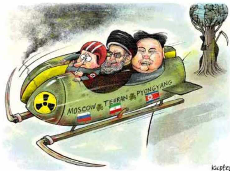
Рис. 7. Карикатура Олексія Кустовського

Висновки і перспективи подальших досліджень. Сатиричні зображення на релігійну тематику, створені українськими карикатуристами у період російсько-української війни (з 2014 року), характеризує поєднання художньої виразності, символізму та ідеологічної гостроти. У художньому аспекті митці активно використовують стилізацію та гротеск, перебільшують риси персонажів або змальовують