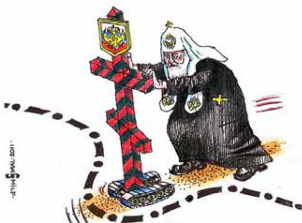
Рис. 1. Карикатура Олега Смаля

тання хреста на гусеницях, що підкреслює дволикість РПЦ у політичному контексті. Яскраві кольори, такі як червоний і чорний, у поєднанні з графічною деталізацією підсилюють драматичний ефект зображення. Чітка лінія, традиційне вбрання та деталі одягу, а також серйозний вираз обличчя патріарха Кирила посилюють пізнаваність його фігури та асоціацію з РПЦ. Композиційно основна увага зосереджена на патріархові та «мобільному» хресті, що символічно наголошує на активній ролі РПЦ в ідеологічному вторгненні. Карикатура містить оригінальний авторський підпис «Smile/Smal» (обігрування слова «усмішка»/«посмішка» і прізвища митця англійською мовою), що ідентифікує художника та підтверджує його авторське право на роботу, а також дату створення, яка додає розуміння історичного контексту (рис. 1).