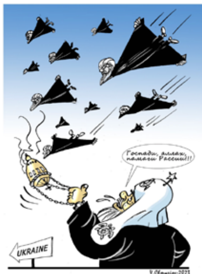
Рис. 6. Карикатура Валерія Чмирьова

ської зброї, що слугує російським інтересам, чим акцентує на персоніфікованій відповідальності Хаменеї за смертоносні атаки. Колористика вирізняється мінімалізмом, з акцентом на чорний і білий кольори, які підкреслюють драматизм ситуації, тоді як синє небо і табличка «Ukraine» слугують візуальними символами жертви і місця агресії. Вигук патріарха Кирила «Господи, аллах, допоможи росії!!!» підсилює сатиричний ефект карикатури й наголошує на абсурдності релігійного виправдання агресії. Підпис митця «V.Chmyriov-2023», розміщений під зображенням, вказує на авторство і рік створення роботи (рис. 6).