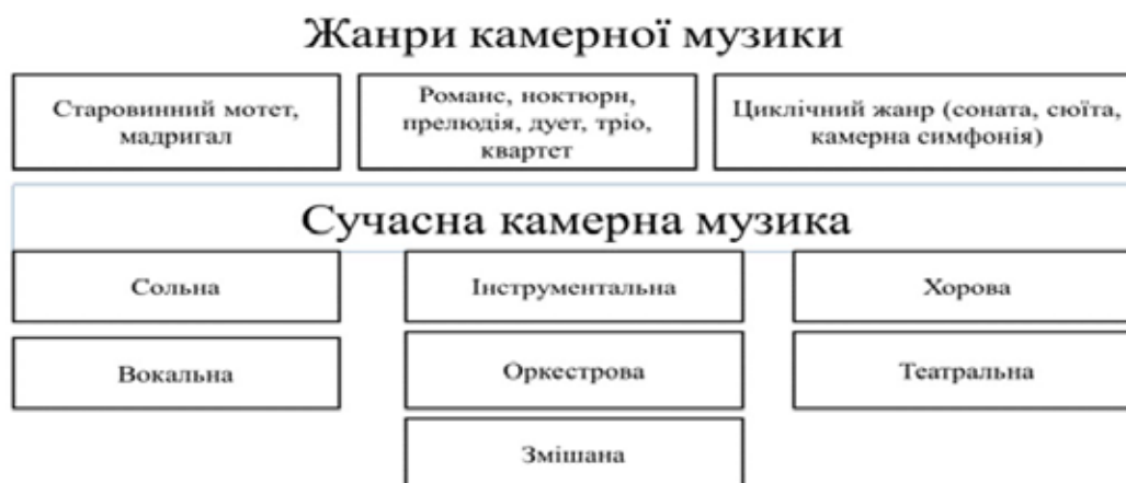
Рис. 2. Жанри камерної музики. Сучасна камерна музика. Створено автором

умовами. Об'єднувало ці лінії завдання створення національних форм музичного мистецтва. Відображення життя свого народу, його побуту, його історії, милування його етносом, бачення яскраві пейзажі української природи та багатства землі на етапі розвитку національних культур завжди стояли у витоках музичної творчості, дозволяючи вирішенню проблем більш ширшого, ідейного, філософсько-гуманістичного плану» (Рукомойнікова О. Рябінін О. 2021).