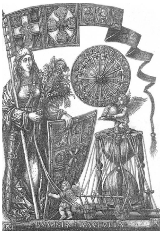
Рис. 3. О. Дишко. Волиня. Аллегорія, 2015