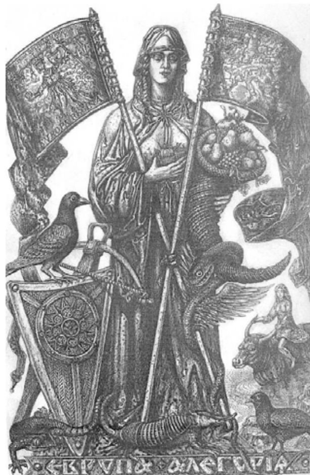
Рис. 4. О. Дишко. Європа. Аллегорія, 2015

Сюрреалістична композиція «Князь Летобор» (2015) (рис. 6) вирішується автором у зображенні князя сидячим на кам'яному престолі, бородатим, з дерев'яним ціпом в руках, двома орлами позаду та вогнищем, перед яким колінопреклонені люди. Увесь його престол густо оплетений стрічкою-літописом, на якій виписана історія дулібів та згадані численні імена їхніх вождів і князів. Для композиції ніби характерна формальна двовимірність простору, але О. Дишко знаходить нові шляхи досягнення третього виміру – час.