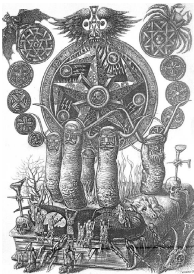
Рис. 1. О. Дишко. Святилище Пентархія, 2018