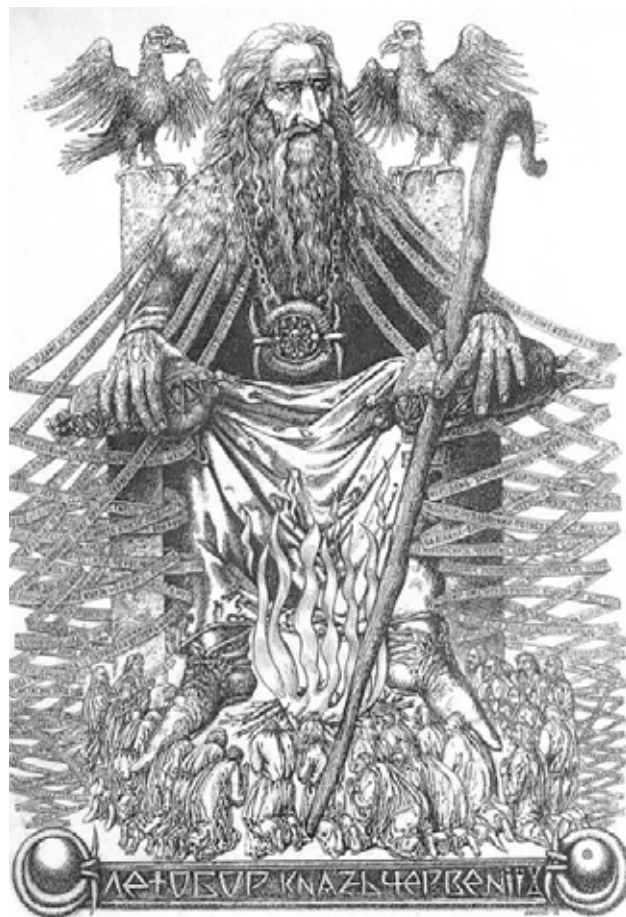
Рис. 6. О. Дишко «Князь Летобор», 2015

Висновки. Проаналізувавши творчий шлях митців творчого об'єднання «Куля» та здійснивши мистецтвознавчий аналіз окремих творів, можна дійти висновку, що сюрреалістичні прийоми, якими часто послуговуються художники, дозволяють ввести глядача у справжній дискурс історії, спонукаючи на мить відчуті себе, то старим вояком-знаменоносцем, то будівничим з кельмою, то ченцем-пілігримом, дзвонарем, і навіть, пережити своєрідний транс, зумовлений оцим балансуванням на межі сну та реальності. Зміст символів-знаків, їхня краса, притягальна сила алгорій у творах митців об'єднання «Куля» сповнені ностальгійно-поетичних відчуттів. Вони – як одкровення, як марення, як незбагнений міраж. У них – щемлива печаль, осяяння мудрістю і, навіть, пережиття катарсису. Хронотип у картинах майстрів вирішує проблеми поєднання простору й часу. Тому в творчих композиціях простір і час є фіктивними реаліями та існують тільки як ідеї.