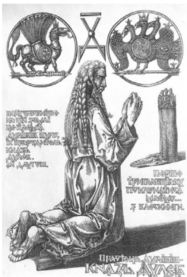
Рис. 5. О. Дишко «Князь Дулеб», 2015