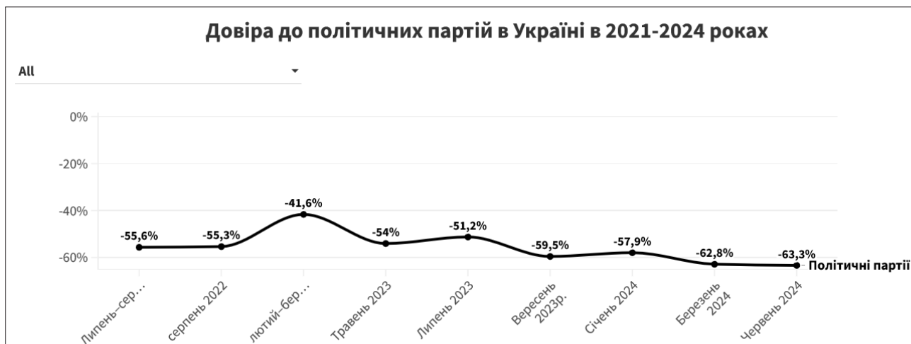
Рис. 1. Баланс довіри-недовіри до політичних партій в Україні у 2021–2024 рр. За даними соціологічних опитувань Центру Разумкова [7]

Натомість вже у травні 2023 р. БДН політичних партій повертається до 54 %, а з вересня 2023 р. до кінця періоду дослідження опускається нижче за показники до повномасштабної війни. В цілому, БДН політичних партій за цей період залишався одним із найнижчих серед усіх соціальних та політичних інститутів. За негативним БДН та динамікою його коливань політичні партії були дуже подібними до категорій «державний апарат (чиновники)» та «суди (судова система в цілому)». Станом на червень 2024 р. їх негативний БДН був на схожому рівні: –63,3 % для політичних партій, –62,8 % для державного апарату та –56,3 % для судової системи.