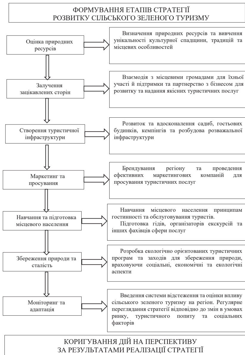
Рис. 3. Стратегія розвитку сільського зеленого туризму