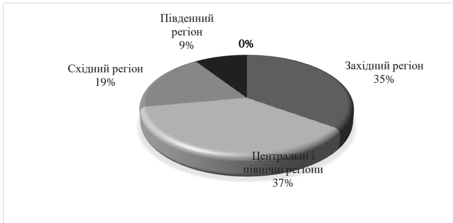
Рис. 2. Частка садиб за регіонами України, 2024 р. [20, с. 120]