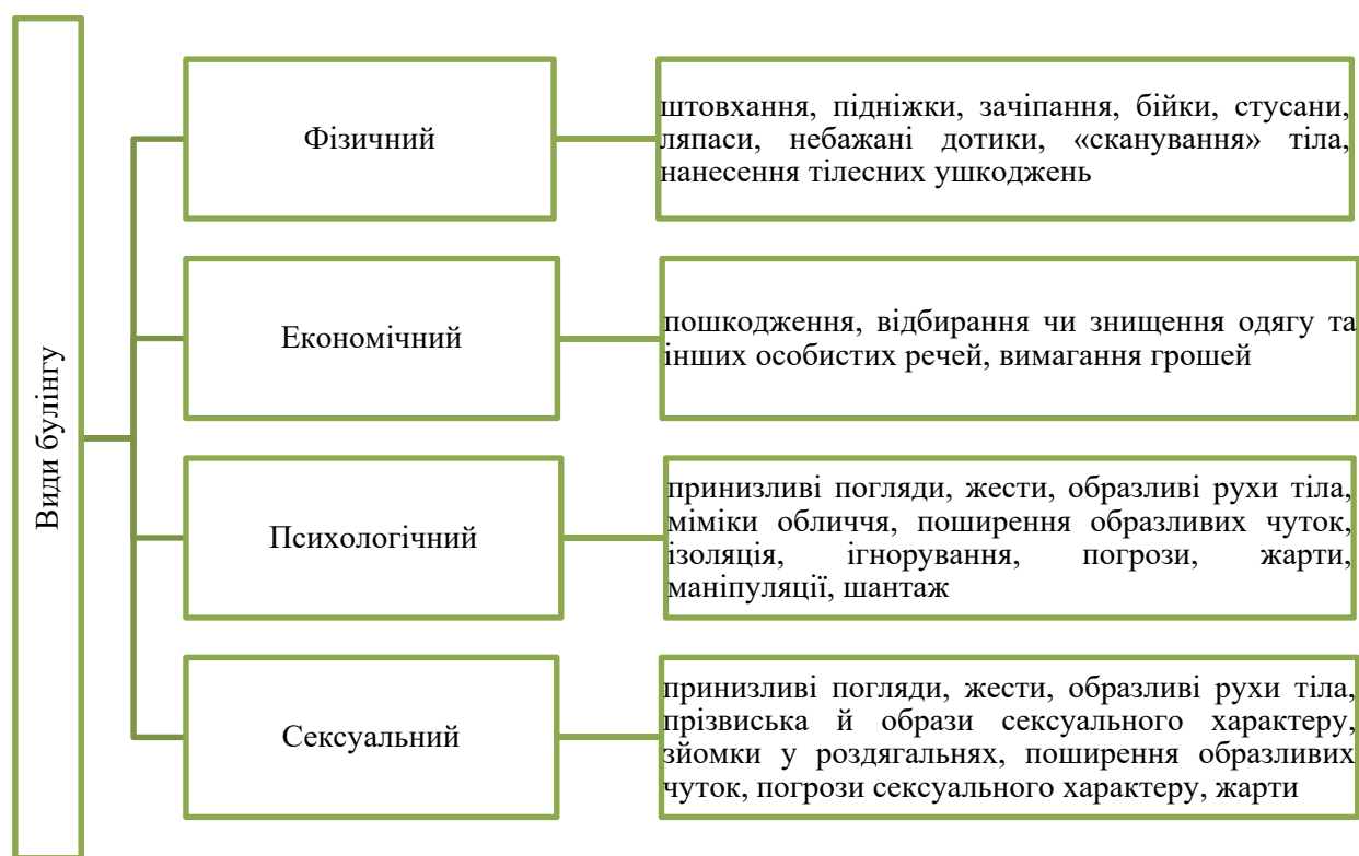
Рис. 1. Види булінгу (згідно Закону України «Про внесення змін до деяких законодавчих актів України щодо протидії булінгу (цькуванню)»)

Типовими ознаками булінгу (цькування) є: систематичність (повторюваність) діяння; наявність сторін – кривдник (булер), потерпілий (жертва булінгу), спостерігачі (за наявності); дії або бездіяльність кривдника, наслідком яких є заподіяння психічної та/або фізичної шкоди,