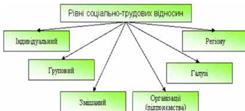
Рис. 2. Рівні соціально-трудова відносин