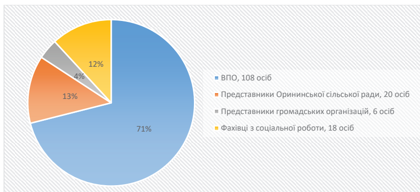
Рис. 1. Розподіл респондентів для проведення дослідження

Результати, свідчать про те, що переселення має як індивідуальний так і сімейний характер, коли люди за власними мотивами та бажаннями виїхали з небезпечних місць проживання, щоб врятувати своє життя та життя своїх близьких. процес переселення здебільшого є індивідуальним, що підтверджують і мотиви вибору місця переміщення, які ми визначали у наступному питанні.