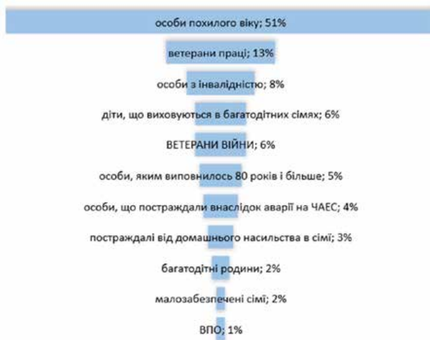
Рис. 1. Частка ветеранів війни у загальній структурі отримувачів соціальних послуг в Луцькій міській територіальній громаді у 2023 р., % (Департамент, 2024)

і 27 довідок про встановлення відповідного статусу дітям;