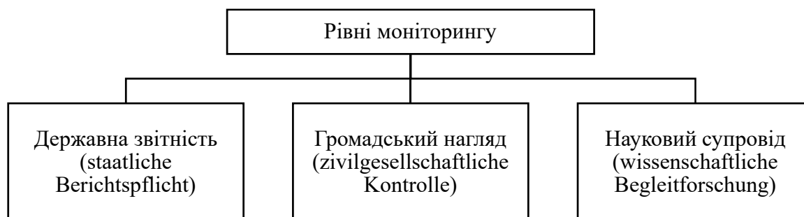
Рис. 1. Рівні моніторингу соціальних проєктів у Німеччині

Так, Федеральне міністерство у справах сім'ї, старших громадян, жінок і молоді – «BMFSFJ»