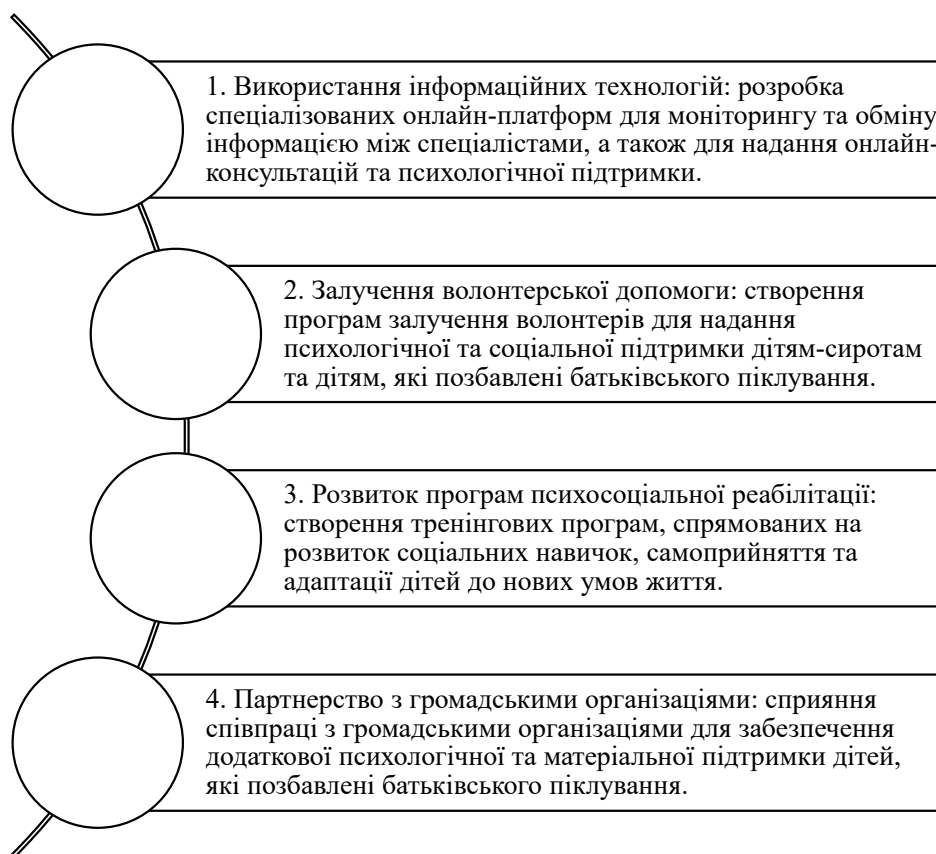
Рис. 1. Напрямки покращення технології соціального супроводу дітей, які позбавлені батьківського піклування

Можливості інноваційних технологій вклю-