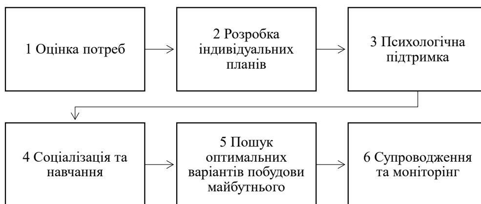
Рис. 2. Комплексна модель соціальної роботи з дітьми, які позбавлені батьківського піклування

5. Пошук оптимальних варіантів побудови майбутнього. Важливо розглядати можливості подальшого планування для дітей, які позбавлені батьківського піклування. Це може включати пошук прийомних сімей, установа опіки, а також складання програми самостій-