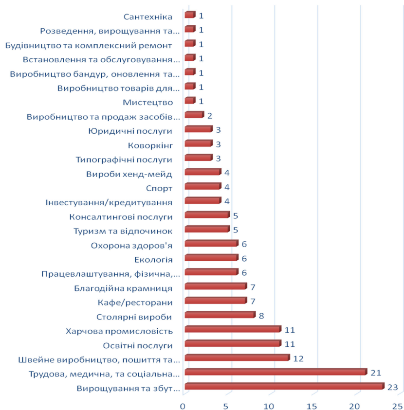
Рис. 1. Види товарів і послуг, які виготовляються і надаються соціальними підприємствами в Україні (Сандакова, 2020, с. 19–24)

торан, прибуток якого спрямований на забезпечення фінансування соціальних проєктів, а працівники – люди з фізичними вадами) (рис. 2).