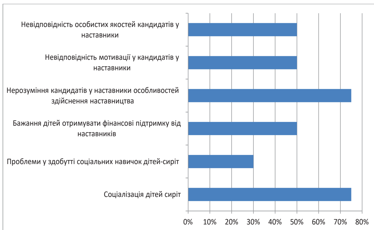
Рис. 1. Проблеми при роботі з наставниками

В ході анкетування респонденти повідомили, які необхідні якості наставника для успішної співпраці з командою фахівців в процесі здійснення наставництва. Це такі, як: наполегливість, любов до дітей, альтруїзм, відповідальність, доброта, чуйність, щирість, стійкість тощо.