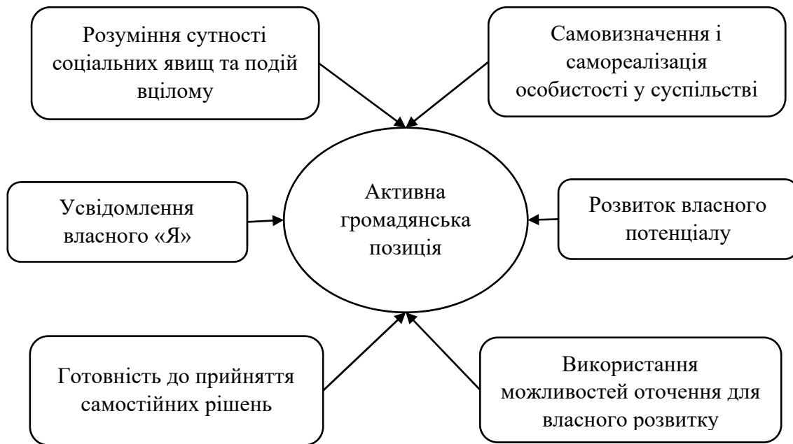
Рис. 1. Шляхи формування активної громадянської позиції студентів через призму політико-правового підходу