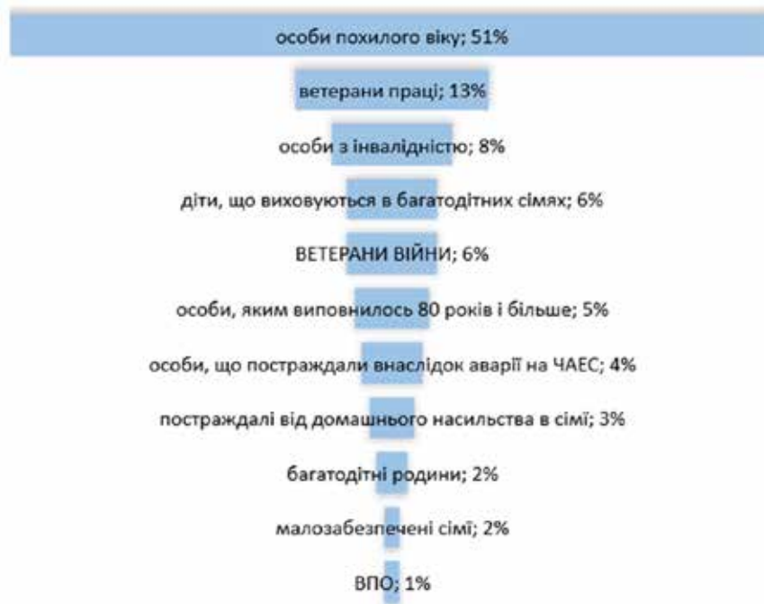
Рис. 1. Частка ветеранів війни у загальній структурі отримувачів соціальних послуг в Луцькій міській територіальній громаді у 2023 р., % (Департамент, 2024)

і 27 довідок про встановлення відповідного статусу дітям;