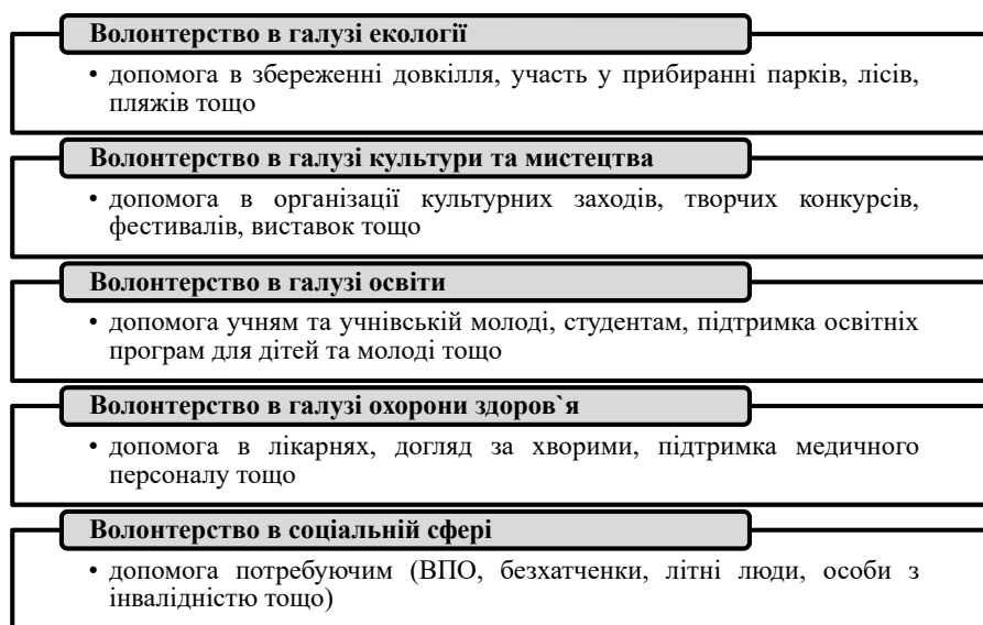
Рис. 1. Напрями волонтерської діяльності студентів

4. Збільшення можливостей для кар'єрного розвитку. Участь у волонтерських ініціативах і програмах може бути цінним додатком до резюме студента, підвищуючи його конкурентоспроможність на ринку праці. Крім того, волонтерська діяльність допомагає розвивати мережу соціальних контактів та здобувати цінний досвід, що може бути корисним у майбутній кар'єрі. Часто попередній досвід волонтерської діяльності для випускника освітньої програми без досвіду попередньої роботи є трампліном у професійній кар'єрі;