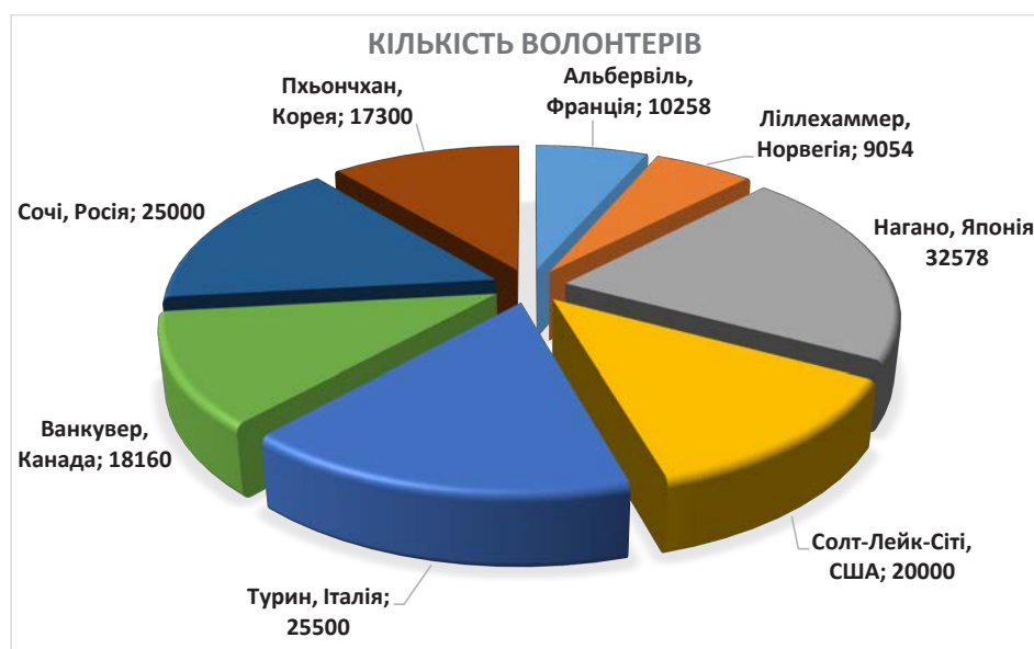
Рис. 2. Участь волонтерів в зимових Олімпійських іграх