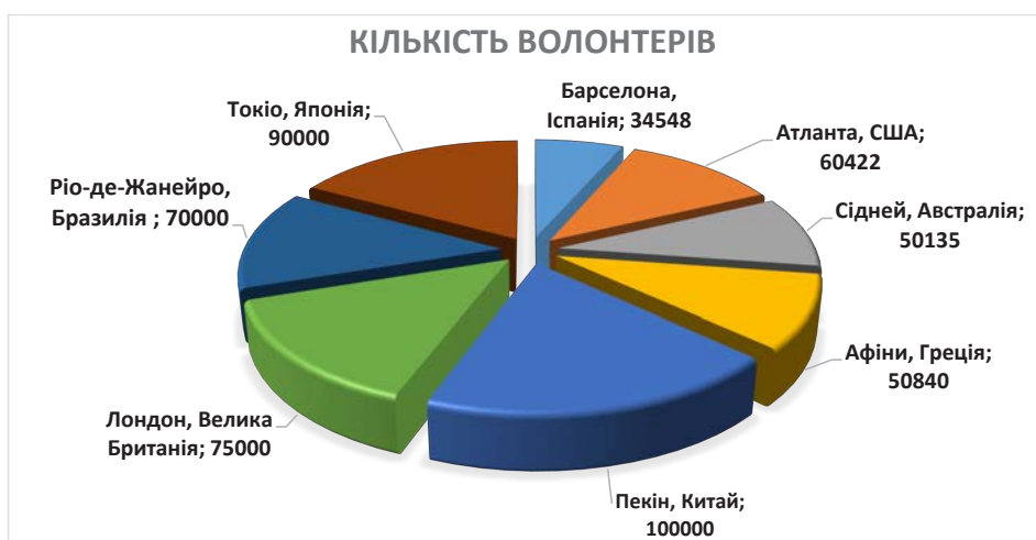
Рис. 1. Участь волонтерів в Іграх Олімпіад

Діяльність волонтерів на спортивних змаганнях допомагає вирішенню низки організаційних питань, а також створенню на спортивному заході відповідної атмосфери і іміджу, які необхідні для настрою учасників і відчуття свята для глядачів. Мотивом такої діяльності може бути бажання реалізувати свої можливості, отримати визнання, відчуття себе частиною великого спортивного свята або популярного заходу, можливість познайомитися з цікавими людьми, знайти нових друзів, встановити ділові контакти. Зрештою, волонтери можуть просто внести різноманітність до свого життя,