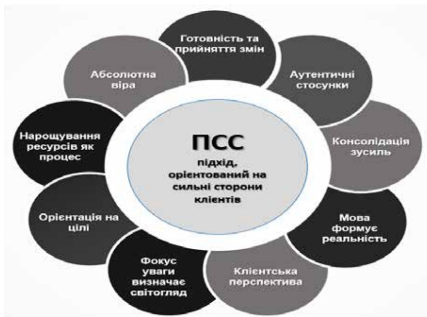
Рис. 1. Принципи підходу, орієнтованого на сильні сторони клієнтів, визначені Геммонд (Hammond, 2010)

нарративи клієнта, навіть, якщо вони мають негативне емоційне забарвлення, адже у них завжди можна віднайти свідчення стійкості та сили, які, можливо, сам клієнт не усвідомлює.