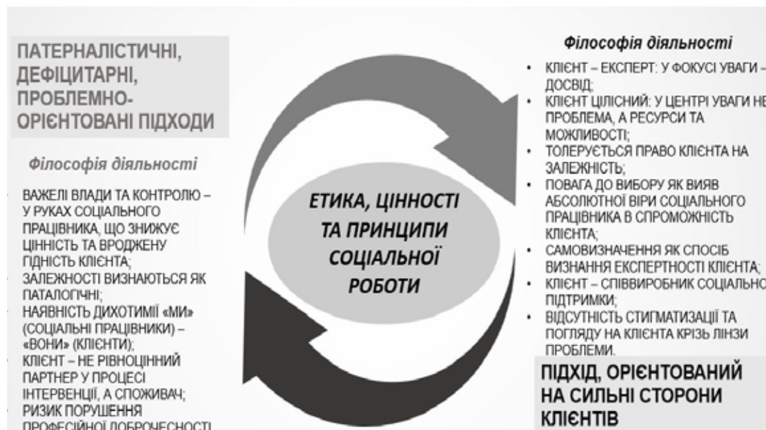
Рис. 2. Відмінності між традиційною практикою соціальної роботи та підходом, орієнтованим на сильні сторони