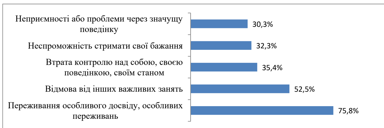
Рис. 1. Поширеність серед опитаних студентів ознак адиктивної поведінки, % (N = 99)

Аналіз взаємозв'язку ступеню ризику адиктивної поведінки студентів та їхніх особистісних рис, що відносяться до п'ятифакторної теорії особистості («Великої п'ятірки»), визначених за допомогою методики ТІРІ UKR, показав його зворотну залежність від таких рис, як «Дружелюбність» (доброзичливість, довірливість, орієнтація на співпрацю з іншими) та «Емоційна стабільність» (стійкість до стресу, врівноваженість, здатність до саморегуляції емоційного стану). При цьому емоційна стабільність має зворотний вплив на формування