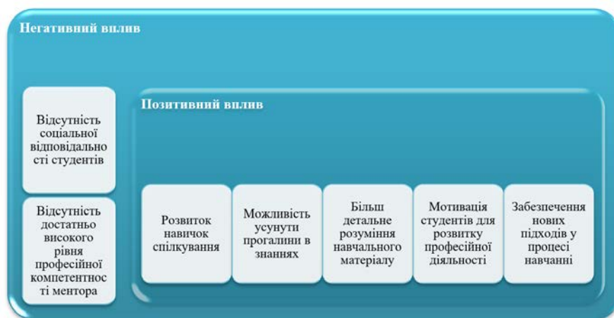
Рис. 1. Визначення рівня впливу механізмів менторства під час підготовки майбутніх учителів

позитивне значення, ніж негативне. У першу чергу це пов'язано із розвитком навичок спілкування, вмінням налагодити конструктивну взаємодію з учасниками освітнього процесу, гармонізацією взаємовідносин з метою передачі практичного досвіду та створення сприятливих умов для професійного зростання.