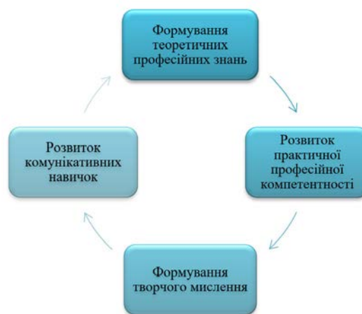
Рис. 2. Розроблені механізми менторства, які спрямовані на розвиток професійної компетентності майбутніх вчителів початкових класів

Визначення позитивного та негативного впливу менторства дозволило розробити механізми менторства у освітньому процесі. Розробка механізмів менторства передбачала орієнтацію на вивчення навчальних підходів та можливість їхнього удосконалення. Механізми менторства не передбачали зміну основної програми навчання майбутніх вчителів початкових класів, а були спрямовані на її доповнення. Розробка механізмів менторства була спрямована для 117 студентів, які навчалися на другому курсі. У якості менторів було залучено 39 аспірантів відповідного професійного спрямування (рис. 2).