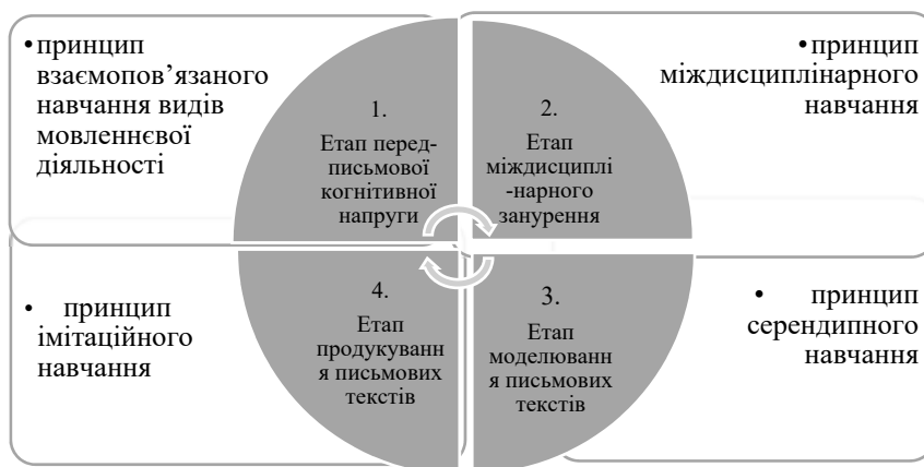
Рис. 1. Модель розвитку навичок аналітико-креативного письма майбутнього вчителя англійської мови та літератури

Як бачимо, окрім незнайомого формату письмового завдання (реакція на позицію автора блогу, висловлення згоди/часткової