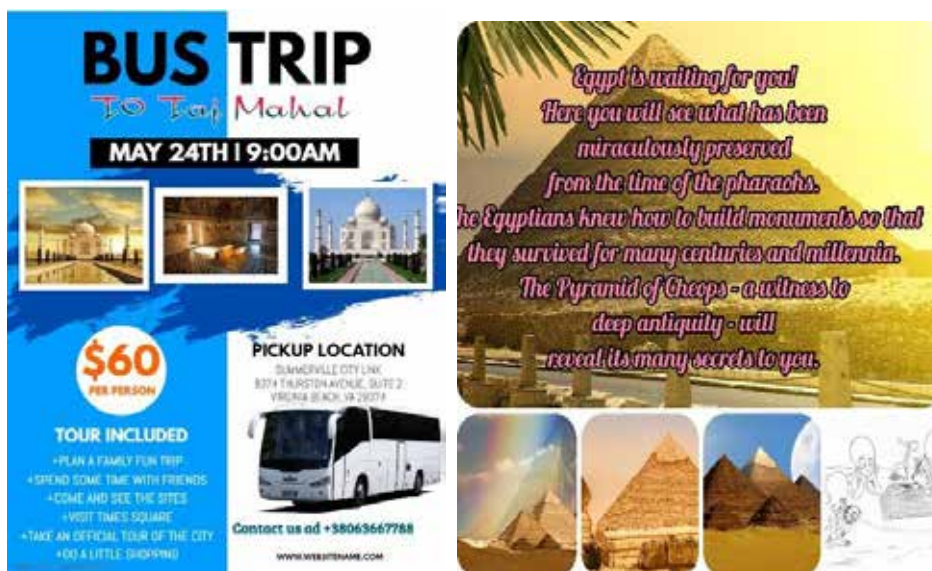
Рис. 3. Приклад розробки студентами інформаційного банеру