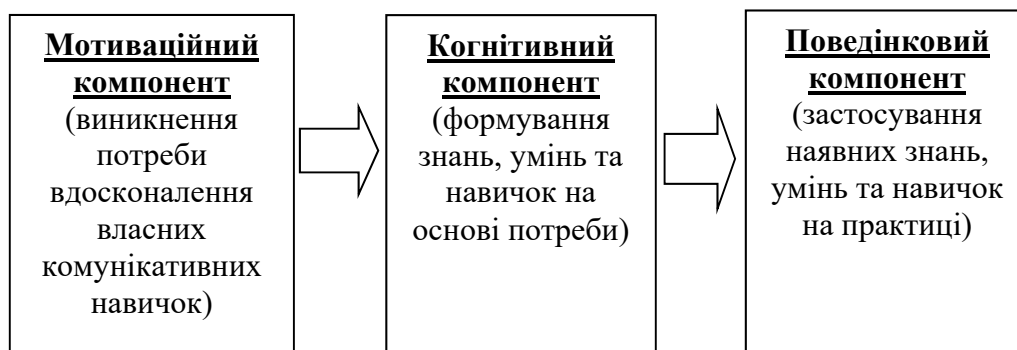
Рисунок 1. Ієрархічна структура основних компонентів комунікативної компетентності студентів-психологів

З огляду на вищесказане можна відзначити, що розвиток комунікативної компетентності у студентів-психологів залежить від рівня та послідовності розвитку основних компонентів компетентності у спілкуванні. Це говорить про те, що розвиток комунікативної компетентності у студентів-психологів носить поступальний, системний та цілеспрямований характер і розвивається в процесі навчання за даним фахом.