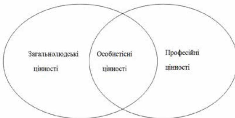
Рис. 1. Структура ціннісно-сислової сфери військовослужбовців – учасників бойових дій

На нашу думку, типологія ціннісних і смислових орієнтацій може мати специфічну структурованість загальнолюдських, професійних і особистісних цінностей. Це пояснюємо тим, що особистість динамічно розвивається протягом життя, проходить численні етапи соціальних і психологічних трансформацій, змінює соціальне середовище, місце і власні ролі в ньому.