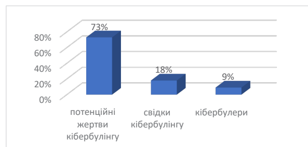
Рис. 1. Результати дослідження кібербулінгу студентів

Кібербулерами за результатами дослідження виявлено 9% студентів, які можуть опублікувати особисту, вигадану або перекручену інформацію про свою жертву, як правило, осоромити її перед іншими, вони створюють фейкові фотографії або відео для наклепу на жертву. Такі студенти не лише руйнують приватність інших, але й можуть розвинути у жертви депресію, тривожність та навіть спонукати до самогубства (рис. 1).