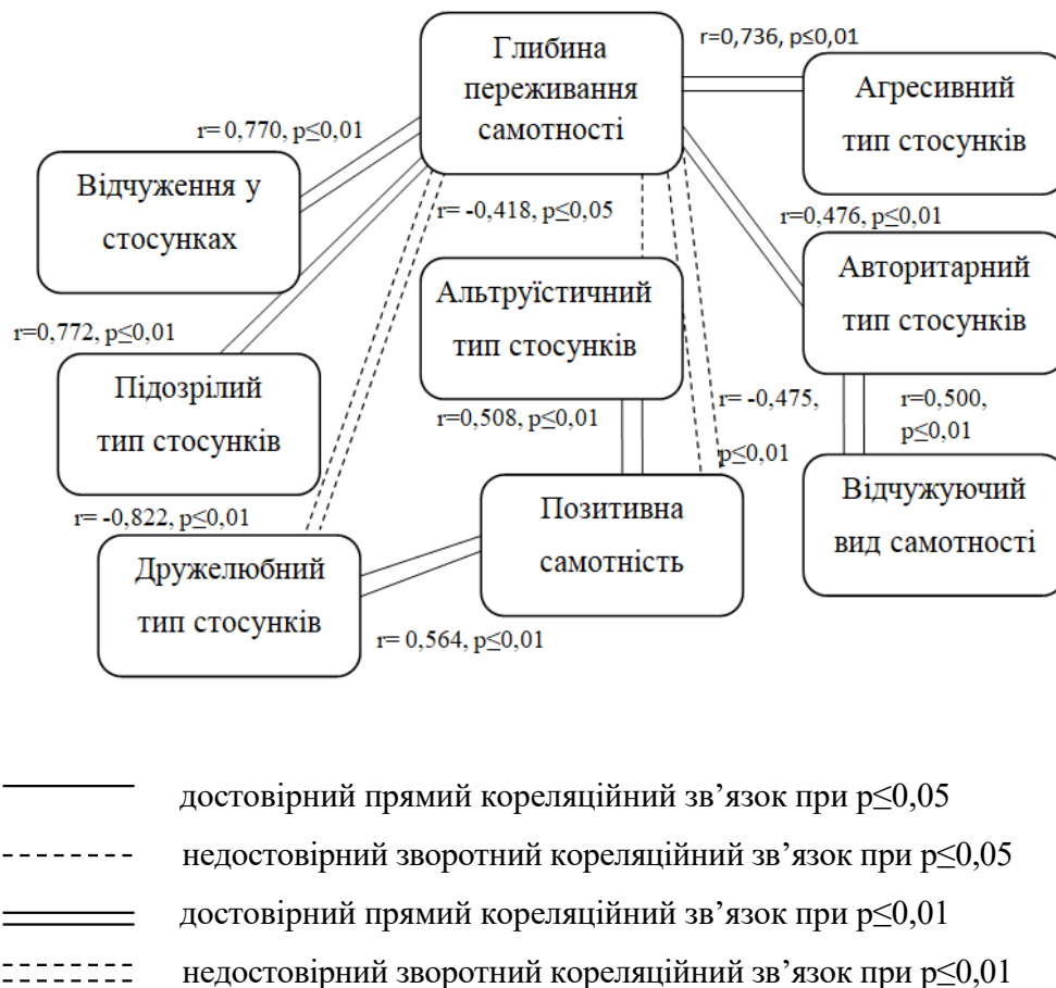
Рис. 1. Кореляційна плеяда зв'язків почуття самотності та міжособистісних характеристик стосунків осіб у віці 40–50 років

Значний прямиий взаємозв'язок був виявлений між відчужуючим видом самотності та авторитарним типом ставлення до оточуючих ( r = 0,500, p \leq 0,01 ), тобто, збільшення відчуженості призводить до більшого прояву авторитарного типу міжособистісних стосунків. Це може бути обумовлено тим, що диктаторський, владний, деспотичний характер особистості, яка лідирує у всіх видах групової діяльності, що проявляється при авторитарному типі стосунків, не вмє приймати поради інших, тому часто оточуючі відвертаються від такої людини.